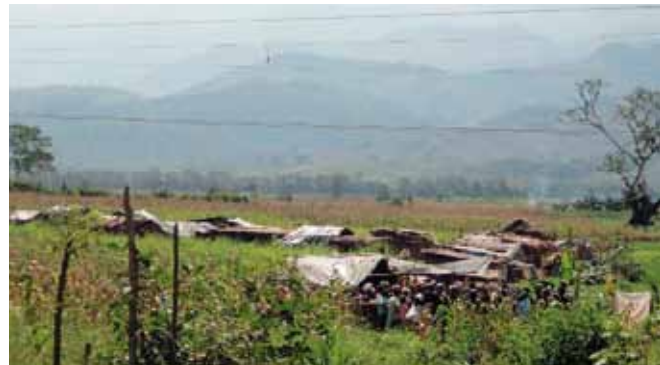
Unter massivem Polizeieinsatz wurde im März 2011 auch die Fica Bella Flor geräumt. Nach dem Einsatz von Tränengas wurden die Hütten und die Felder der Landarbeiter zerstört.

Im März 2011 kam es zu gewaltsamen Konfrontationen, bei denen ein Landarbeiter starb und mindestens sechs schwer verletzt wurden. In den darauffolgenden Wochen wurden alle Ländereien geräumt. Auch die Familien auf der Finca Bella Flor mussten das Land verlassen. Viele sind vorerst bei Verwandten und Freunden untergekommen. Sie wissen nicht, wie sie in Zukunft überleben sollen.