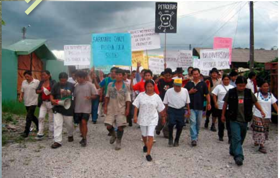
Proteste der Bewohner von Sarayaku gegen die geplante Förderung von Erdöl.

Anhörung vor dem Interamerikanischen Gerichtshof für Menschenrechte in Costa Rica