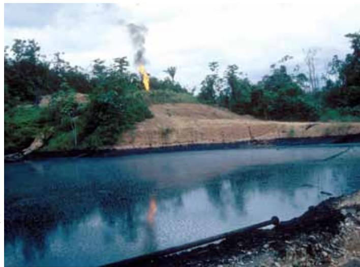
Erdölförderung in Cuyabeno