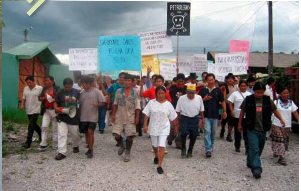
Proteste der Bewohner von Sarayaku gegen die geplante Förderung von Erdöl.

Anhörung vor dem Interamerikanischen Gerichtshof für Menschenrechte in Costa Rica